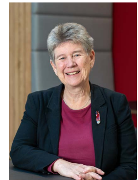
Jane Hutt AS

Ysgrifennydd y Cabinet dros Gyfiawnder Cymdeithasol, Trefnydd a Phrif Chwip