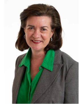
Eluned Morgan AS Prif Weinidog Cymru

Gadewch inni symud ymlaen gyda phenderfyniad a gobaidh, gan wybod y bydd ein hymdrechion ar y cyd yn helpu i greu cymdeithas fwy cyfiawn, gwrth-hiliol a theg i bawb.