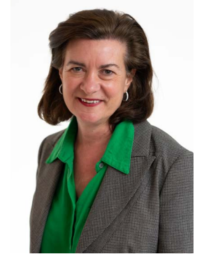
Eluned Morgan AS

Gadewch inni symud ymlaen gyda phenderfyniad a gobaid, gan wybod y bydd ein hymdrechion ar y cyd yn helpu i greu cymdeithas fwy cyfiawn, gwrth-hiliol a theg i bawb.