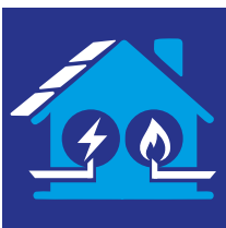
Adeiladau a Chyfleustodau

Rydym yn darparu gwerth drwy gaffael ar draws y saith maes categori canlynol: