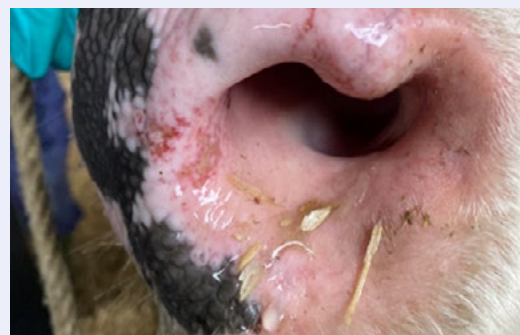
Briwiau yn y ffroenau