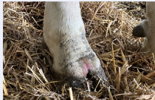
Hollt y carn yn goch