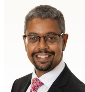
Vaughan Gething AS PRIF WEINIDOG CYMRU