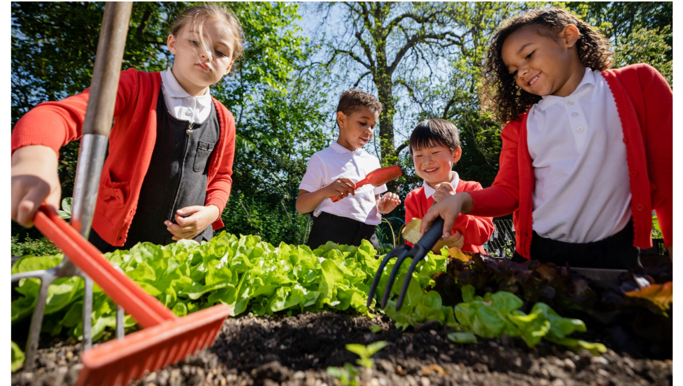
Ffigur 2 Sut mae ein polisiau sy'n ymwneud â bwyd yn cyfrannu at amcanion llesiant Llywodraeth Cymru.

Mae cynnydd tuag at nodau llesiant Deddf LICD yn cael ei fesur gan Ddangosyddion Llesiant Cenedlaethol , gyda chyflymder y newid yn cael ei fesur gan Gerrig Milltir Cenedlaethol. Ni chyfeirir yn benodol at fwyd ar hyn o bryd yn y Dangosyddion Cenedlaethol, er bod dangosyddion sy'n berthnasol i fwyta a chynhyrchu bwyd, megis tlodi, ffyrdd iach o fyw a'r amgylchedd naturiol. Byddwn yn ystyried yr achos dros fwyd yn y Dangosyddion Cenedlaethol pan gânt eu hadolygu nesaf. Yn y cyfamser, byddwn yn ystyried gyda rhanddeiliaid a oes gwybodaeth ystadegol o ansawdd da eisoes ar gael am fwyd y gellir ei chynnwys fel gwybodaeth gyd-destunol yn adroddiadau blynyddol Llesiant Cymru .