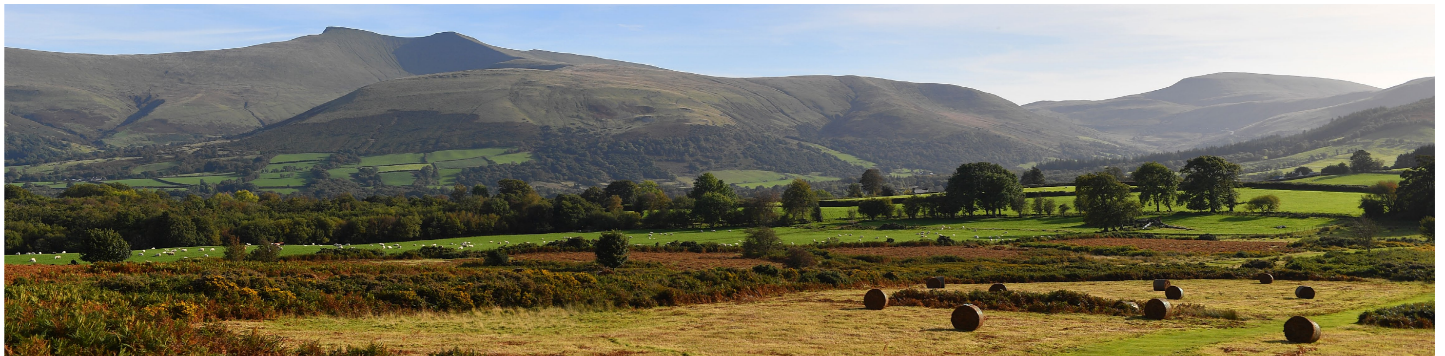
2 Trosolwg o Brosiect HELIX Mehefin 2016 – Mehefin 2023 - Arloesi Bwyd Cymru

Rydym yn canolbwyntio ar leihau ac atal gwastraff ar draws y system fwyd. Mae ein Strategaeth Mwy nag Ailgylchu (SMA) yn gweithio i wneud yr economi gylchol yng Nghymru yn realiti ac mae'n ymrwymo i ddileu pob gwastraff bwyd y gellir ei osgoi drwy weithio gyda chynhyrchwyr a phroseswyr bwyd ar draws y gadwyn gyflenwi gyfan, i gyfyngu ar wastraff bwyd ym mhob lleoliad. Mae SMA yn gosod targed i haneru gwastraff bwyd y gellir ei osgoi erbyn 2025, a 60% erbyn 2030. Mae Map Trywydd Gwastraff Bwyd Cymru yn nodi camau gweithredu i helpu i gyrraedd y targed. Gan gydnabod ein lle o fewn system fwyd y DU gyfan, rydym yn bartner gweithredol i'r Ymrwymiad Courtauld 2030 sy'n gytundeb