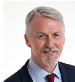
Huw Irranca-Davies AS YSGRIFENNYDD Y CABINET DROS NEWID HINSAWDD A MATERION GWLEDIG