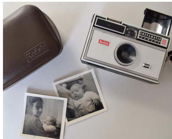
Lluniau o wyliau a dathliadau teuluol

I sbarduno atgofion o yrru mewn sir wledig, dewiswyd delweddau digidol o lawlyfr yr AA