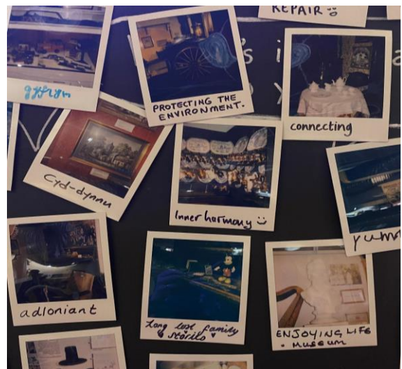
Ymatebion Polaroid Perthyn

Yn y gweithgaredd hwn, gofynnwyd i 130 o ymwelwyr cyffredinol i'r amgueddfa dynnu llun Polaroid o wrthrych a oedd wedi'i arddangos. Gofynnwyd i'r cyfranogywr sut roedd yn cysylltu ag un o werthoedd eu bywyd ac ym mha ffyrdd roedd yn ystyrlon iddynt. Yna, integreiddiwyd y lluniau Polaroid mewn mapgwerthoedd a wellodd ddealltwriaeth o werthoedd y gymuned.