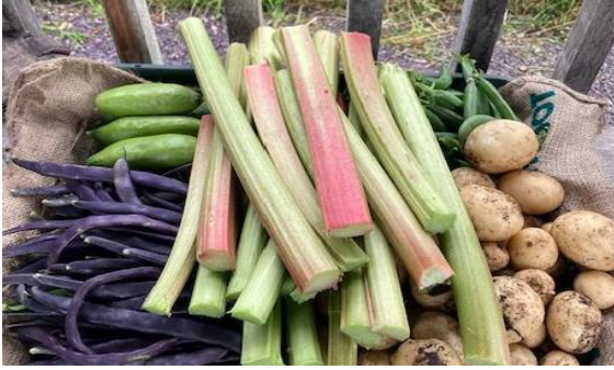
Mae cynaeafu'n gwella llesiant corfforol