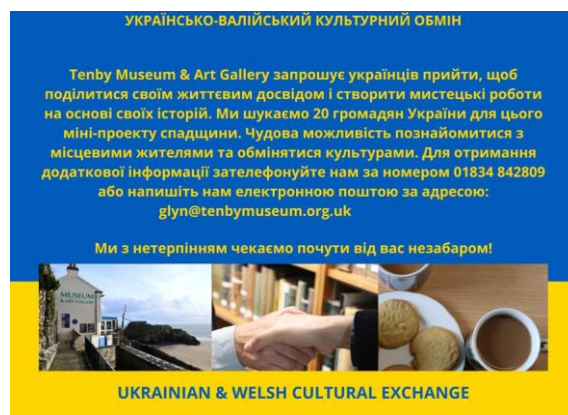
Cafodd hysbysebion eu cyfieithu i Wreineg

Darparwyd lluniaeth er mwyn darparu amgylchedd croesawgar a helpodd i greu naws ymlaciol i ddechrau. Cynigiwyd bwyd Prydeinig traddodiadol fel te, cramwyth, cacennau a Marmite. Y danteithfwyd o Gymru Bara Brith oedd fwyaf poblogaidd o bell ffordd a gofynnodd sawl un am gael y rysáit.