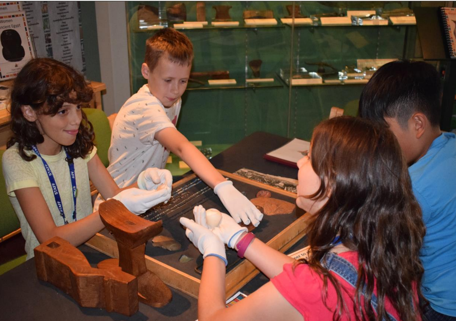
Gwirfoddolwyr ifanc yn yr oriel

“Mae’r Ganolfan Eifftaidd yn ymdrechu i fod mor gynhwysol â phosibl. Drwy wreiddio ymdeimlad o deulu, perthyn a chymuned ymysg ei gwirfoddolwyr, mae’n eu cynorthwyo i gyrraedd eu potensial llawn. Mae’n gwella nid yn unig eu bywydau eu hunain, ond bywydau’r sawl sy’n ymweld â’r amgueddfa”.