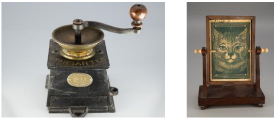
Arteffactau a ddewiswyd ar gyfer 'Gwrthrychau'n Ganolog' / 'Objects in Focus'

Detholwyd termau allweddol i'w defnyddio yn y gronfa ddata MODES i amlygu ymerodraeth a threfedigaethau.