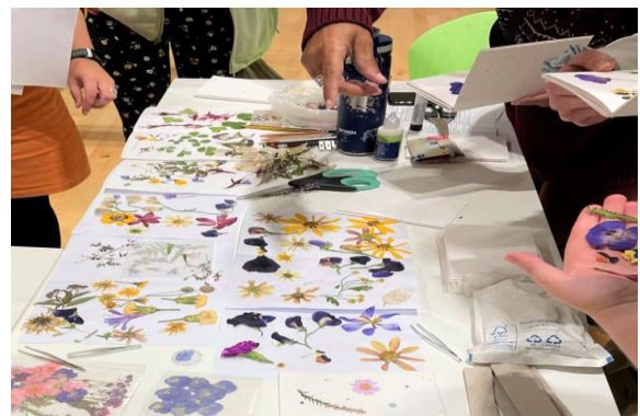
Llyfrau braslunio blodau â thema LHDTTC+

Gan weithio gydag artist lleol o Gonwy, creodd cyfranogwyr eu llyfr braslunio bach eu hunain gan ddefnyddio blodau gwasgedig/sych wedi'u hysbrydoli gan gyfeiriadau a symbolau LHDTTC+. Roedd gweithdy creu bag ysgwydd wedi'i ysbrydoli gan Arddangosfa Balchder Llyfrgell Bae Colwyn a dathliadau Balchder hefyd yn boblogaidd.