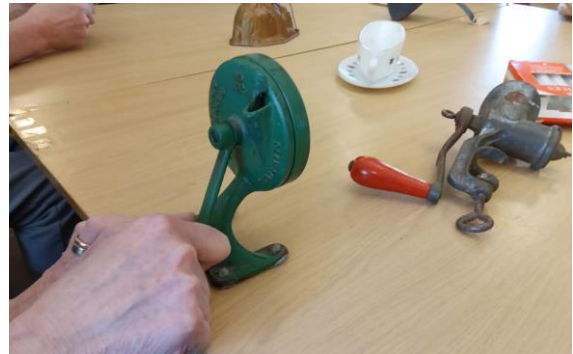
Trafod gwrthrychau a hel atgofion

atgofion â thema, trafod gwrthrychau a gweithgaredd crefft.