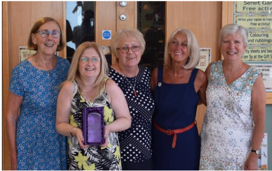
Gwobr y Frenhines am Wasanaeth Gwirfoddol

Mae gwirfoddolwyr ifanc yn helpu ar ddydd Sadwrn drwy ddarparu arddangosiadau a theithiau. Mae'n bosibl eu bod yn gwirfoddoli oherwydd eu bod wedi'u hysbrydoli gan weithdy neu drwy weld pobl ifanc eraill yn gwirfoddoli.