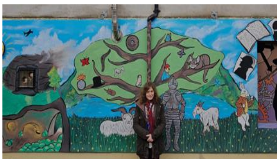
Murlun ar wal yr ardd

Er mwyn sicrhau bod yr hyfforddiant yn amrywiol, gwneir defnydd o arbenigedd staff, mewnbwn gan addysgwyr sydd wedi ymddeool ac arbenigwyr ar amgueddfeydd.