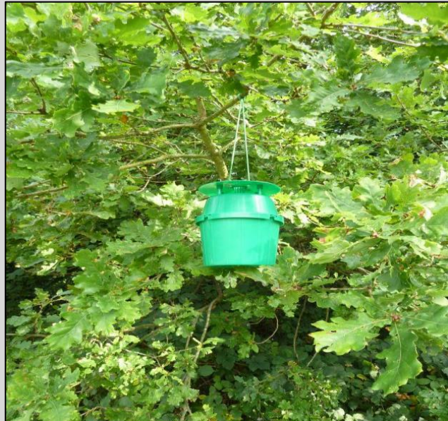
Enghraifft o drap bwced i ddal pryfed.

Rhennir gwybodaeth yn rheolaidd rhwng Forest Research a phartneriaid allanol. Hwylusodd digwyddiadau rhwydweithio gwerthfawr gyda chydweithwyr o'r Asiantaeth Iechyd Anifeiliaid a Phlanhigion y gwaith o ddatblygu cysylltiadau gwaith a chydweithio â safleoedd Sentinel sy'n bodoli eisoes. Mae cydweithio agos a chyson gyda Cyfoeth Naturiol Cymru wedi galluogi'r gwaith o fynd i goetiroedd Cyfoeth Naturiol Cymru yn hwylus ac yn rheolaidd er mwyn defnyddio trapiau.