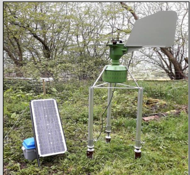
Enghraifft o drap sborau Burkard.

Yn rhan o'r prosiect, rydym yn awyddus i Safleoedd Sentinel eraill feithrin cysylltiadau yn weithredol gyda Rhwydwaith Gwylidwriaeth Iechyd Planhigion Cymru a chynnig lleoliadau ar gyfer rhagor o drefniadau gosod trapiau ac archwilio. Os yw'r prosiect hwn o ddi-ddordeb i'ch safle chi, mae croeso i chi gysylltu â Daniel.Wood001@llyw.cymru neu'r cysylltiadau isod a byddem yn hapus i drafod ymhellach â chi.