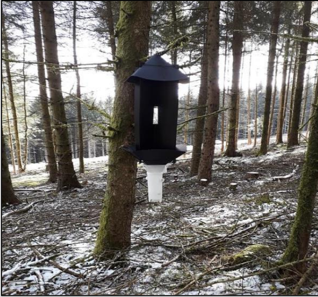
Enghraifft o drap pryfed esgyll croes.

Mae rhannu gwybodaeth ac addysg i'r cyhoedd yn allbwn pwysig o'r prosiect hwn. Bydd tîm Rhwydwaith Gwylidwriaeth Iechyd Planhigion Cymru felly yn parhau i gymryd rhan mewn gweithgareddau ymgysylltu megis y Sioe Frenhinol flynyddol, Arddangosfa'r Gymdeithas Coedwigwyr Proffesiynol (sioe goedwigaeth, coetiroedd a choedyddiaeth fwyaf y DU) a gynhelir ddwywaith y flwyddyn, a'r Gynhadledd Iechyd Planhigion Ryngwladol a gynhaliwyd yn ddiweddar yn Llundain.