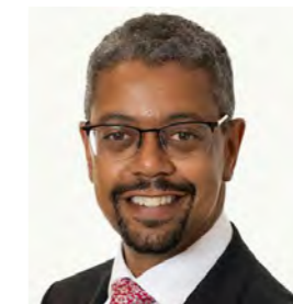
Vaughan Gething Gweinidog yr Economi

Edrychaf ymlaen at weithio gyda chi i ddarparu pecyn newydd o gymorth cyflogadwyedd a sgiliau a fydd yn cryfhau ein nod o greu Cymru Decach, Gryfach a Gwyrddach i bawb.