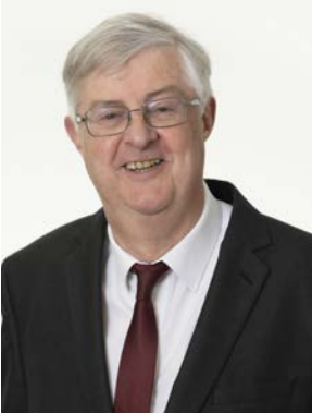
Mark Drakeford