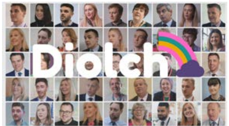
Kirsty Williams AS Y Gweinidog Addysg

“Gallwn fod yn hyderus bod ein diwygiadau yn rhoi'r cyfle gorau i'n pobl ifanc a'n system addysg ffynnu.”