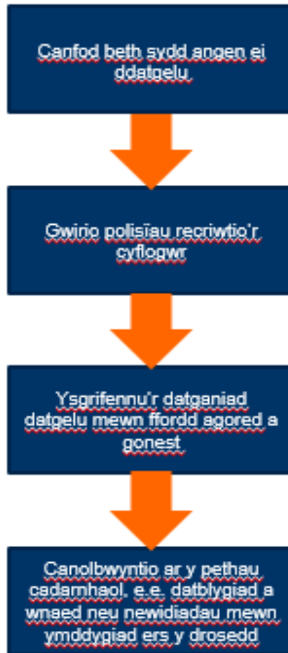
Ffigur 3: Camau allweddol wrth wneud datgeliad i gyflogwr

Mae'r camau allweddol wrth wneud datgeliad i gyflogwr wedi'u crynhoi yn Ffigur 3.