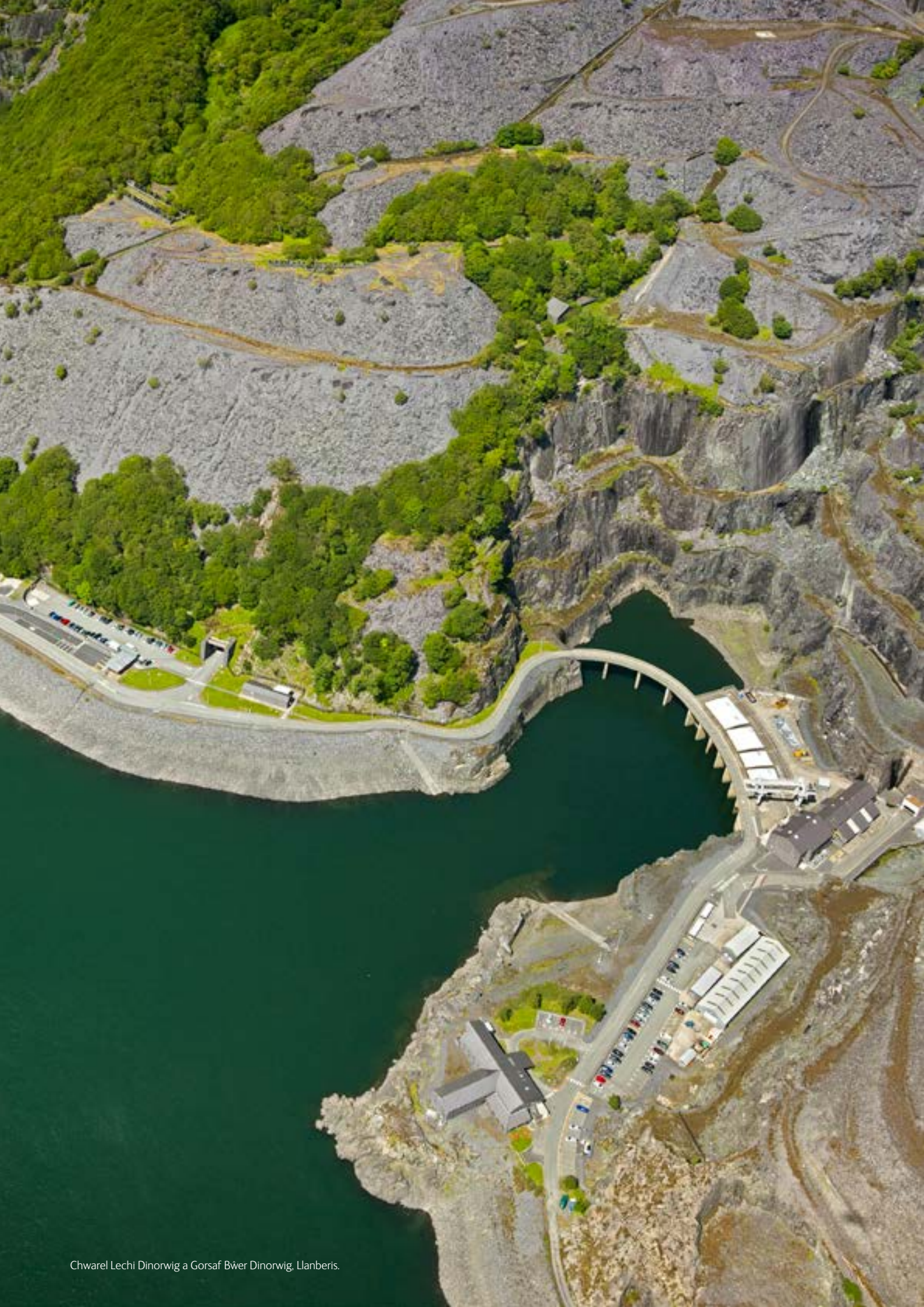
Chwarel Lechi Dinorwig a Gorsaf Bŵer Dinorwig, Llanberis.