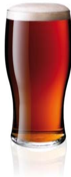
Tafarndai: Bydd y gyfraith ddi-fwg yn cwmpasu tafarndai a chlybiau

Cwmpesir llongau gan reoliadau a wneir gan Adran Drafnidiaeth y DU.