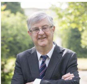
Mark Drakeford AS

Bydd hwn yn gynllun ymarferol, â champau gweithredu penodol i'w cymryd ym mhob maes polisi allweddol. Mae wedi cael ei gyd-awduro a'i ddatblygu mewn ffordd gydweithredol, ac rydym yn ddiolchgar i bawb sydd wedi ein helpu hyd yma. Ond mae angen eich mewnbwn arnom o hyd. Mae'n rhaid i ni fod yn siŵr ein bod wedi cynnwys y blaenoriaethau cywir, a bod yn glir ynghylch sut y cânt eu gweithredu. Edrychwn ymlaen at gael eich mewnbwn."